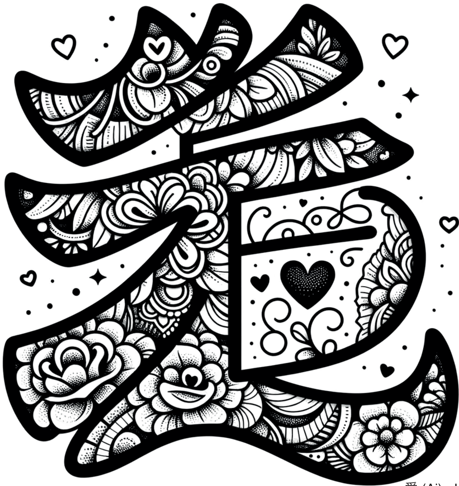
愛 (Ai) - Love